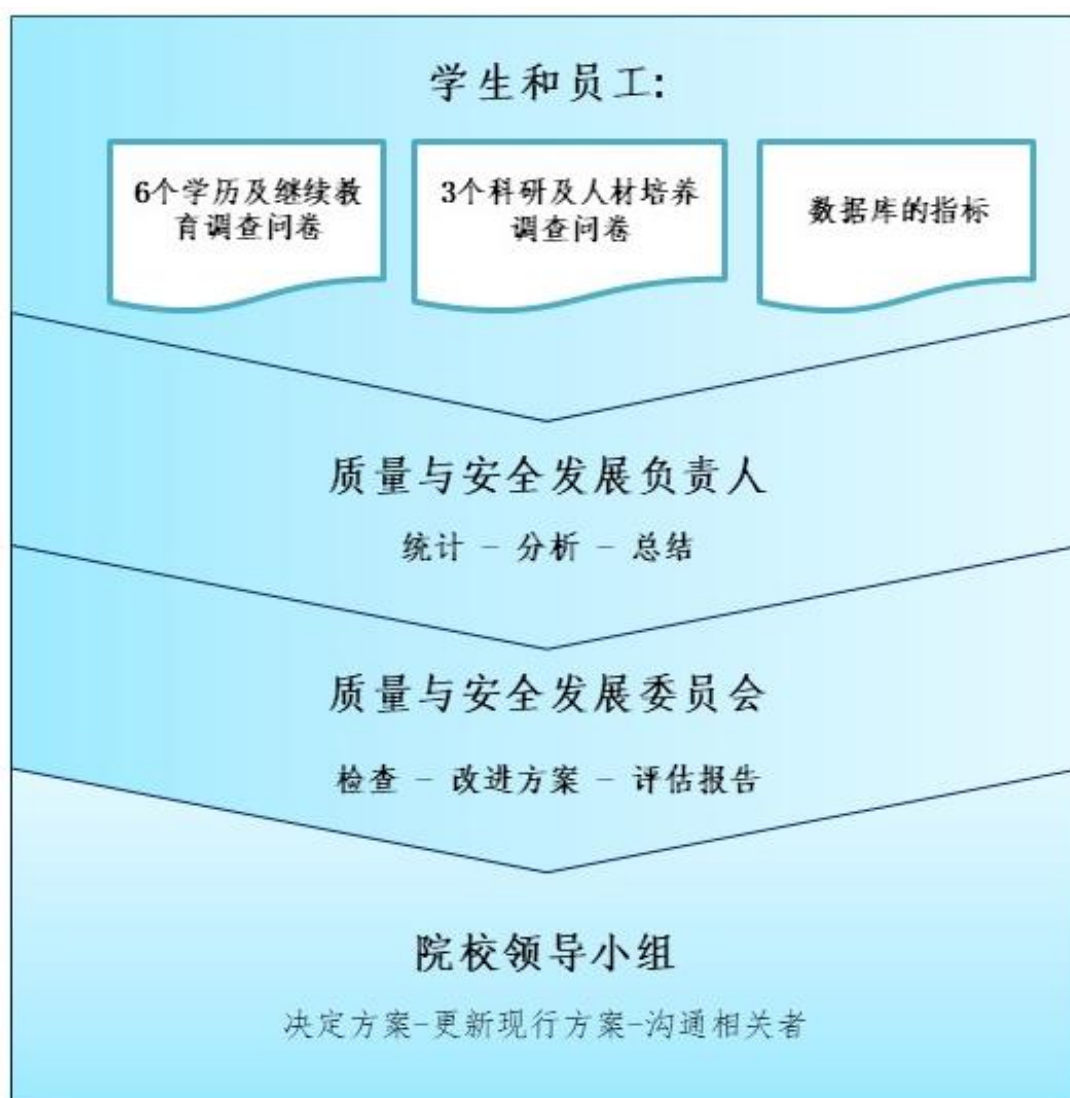
图 2. 流程及职责图